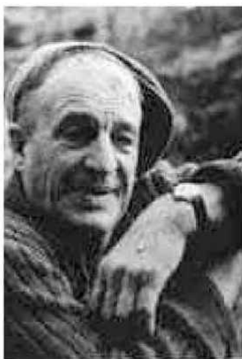
Un rare portrait de Rodney William Whitaker, auteur du roman « Shibumi ».

Nicolaï Hel est un tueur à gage redoutable. Une sorte de Ronin, samouraï sans maître. Initié au jeu de go et à bien d'autres connaissances rares depuis son adolescence, cet homme hors du